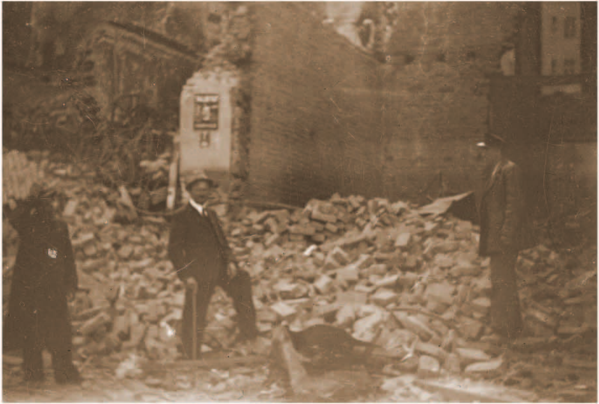
Totally demolished store, alongside with 100000 records, prob. April or May 1941