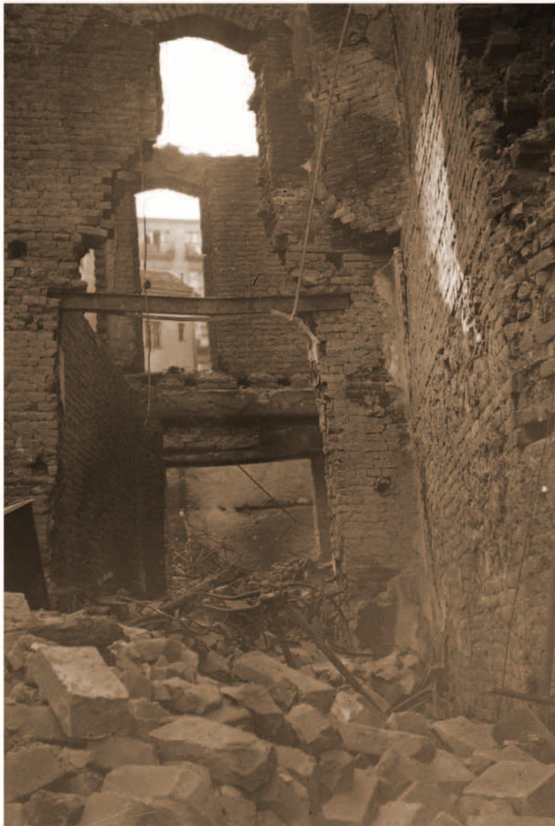
Totally demolished store, ruins, prob. April or May 1941