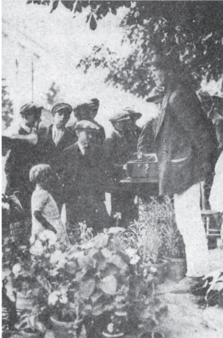
Gramophone, public demonstration, Belgrade, 1920